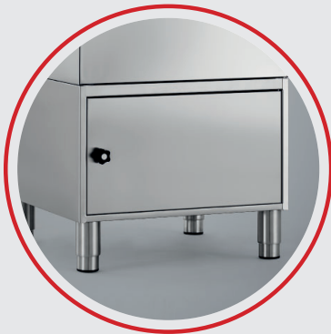
Socle 400 mm avec pieds réglables