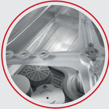
Tourniquet de lavage et rinçage + filtre cuve