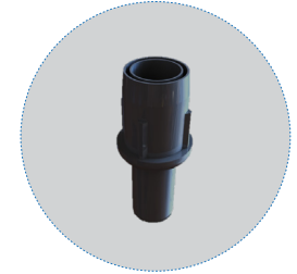
أرجل قاعدية قابلة للتعديل