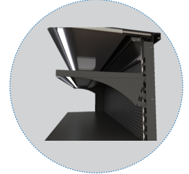
أرفف قابلة للتعديل